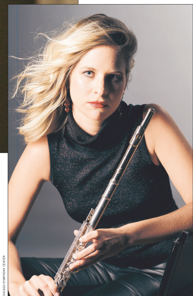
CHICAGO SYMPHONY CENTER

No deje de ver "Caminos del Inka" Dónde: Symphony Center, 220 S. Michigan Ave. Chicago, IL Cuándo: Viernes a las 1 pm y sábado a las 8 pm Boletos: $31-$199 Información: (312) 294-3000 y www.cso.org